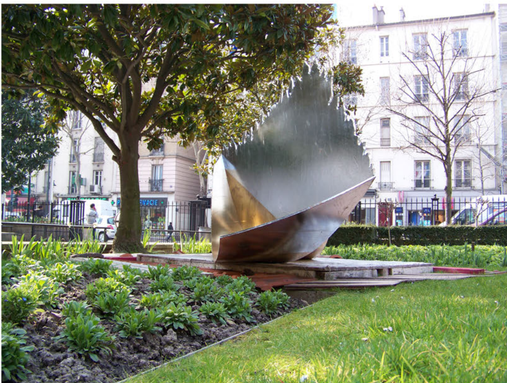
L'eau-delà "The Water Beyond" Installation, Semaine des Arts plastiques 2013 à Clichy-la-Ga- renne

Matériel utilisé : couverture de survie marouflée sur contrepla- qué, Bois récupéré, taules et tuiles et volet en bois Dimension : H-2,05m x L-5,00 m